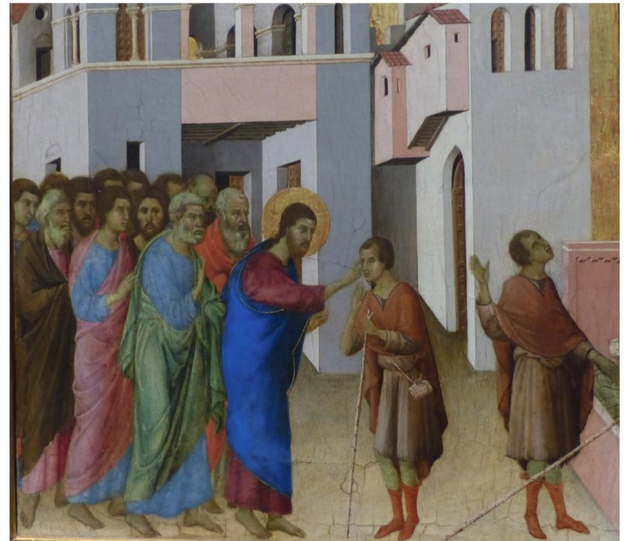
Die Heilung des Blinden -Duccio di Buoninsegna-

Heiliges Kreuz, sei hoch verehret, hartes Ruhbett meines Herrn!